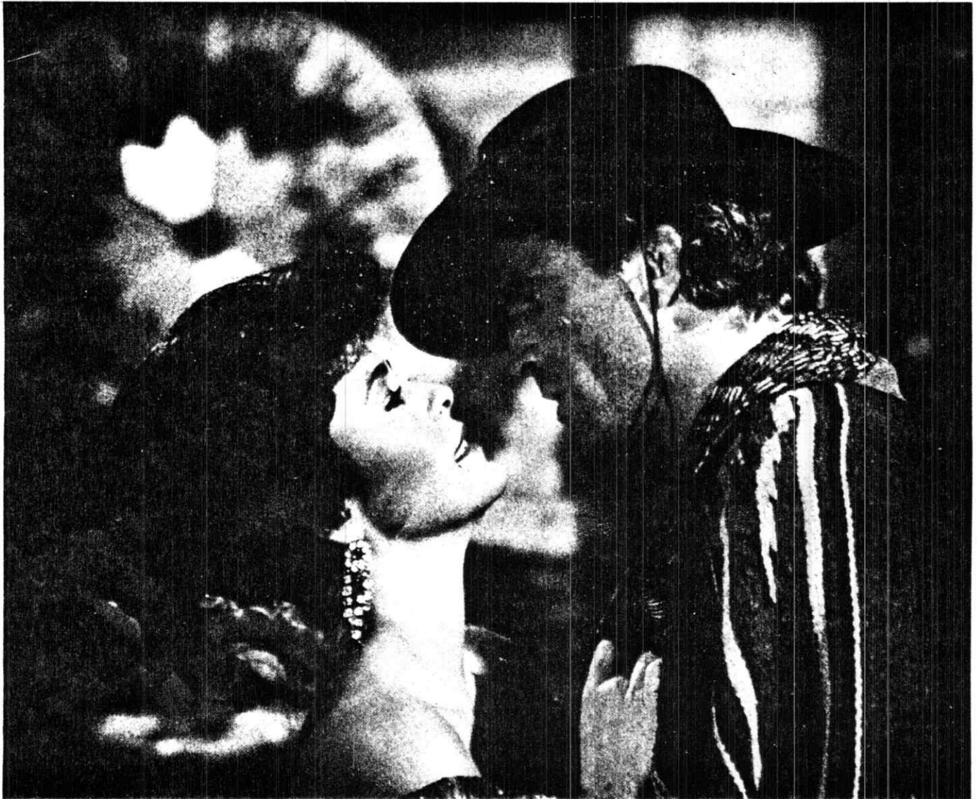
Ya ha hecho cuatro películas y va para la quinta, que comenzará a filmar próximamente.

—Pues sí. No es que lo hecho haya ido en contra de mis principios; eso no lo haría, por respeto a mí misma. Yo sé que, a la larga, todo sale en la vida, lo bueno y lo malo, sobre todo, lo malo. Lo que quiero decir es que he tenido que asistir a fiestas y reuniones que no me interesaban. Prefiero lo íntimo, lo familiar, entre amigos, pero cuando llegué a Los Angeles necesitaba conocer a gente del ambiente, dejar que los fotógrafos se ocuparan de mí y todo lo que contribuye a destacar a un artista. Yo salí de Venezuela siendo